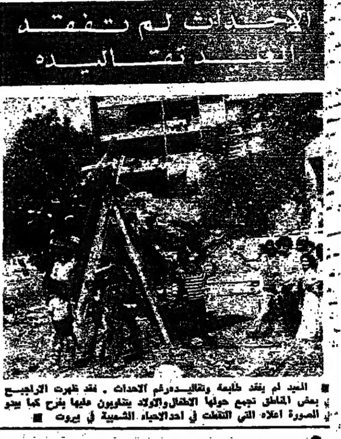
الميد لم يقد طيعة وبالسدرم الاحداث . فقد ظهرت التراجيح في بعض المناطق تجمع حولها الاطفال والاولاد يتخربون عليها ويترن كما يبدو في الصورة اعلاه التي التقطت في احد الاحياء الشعبية في بيروت